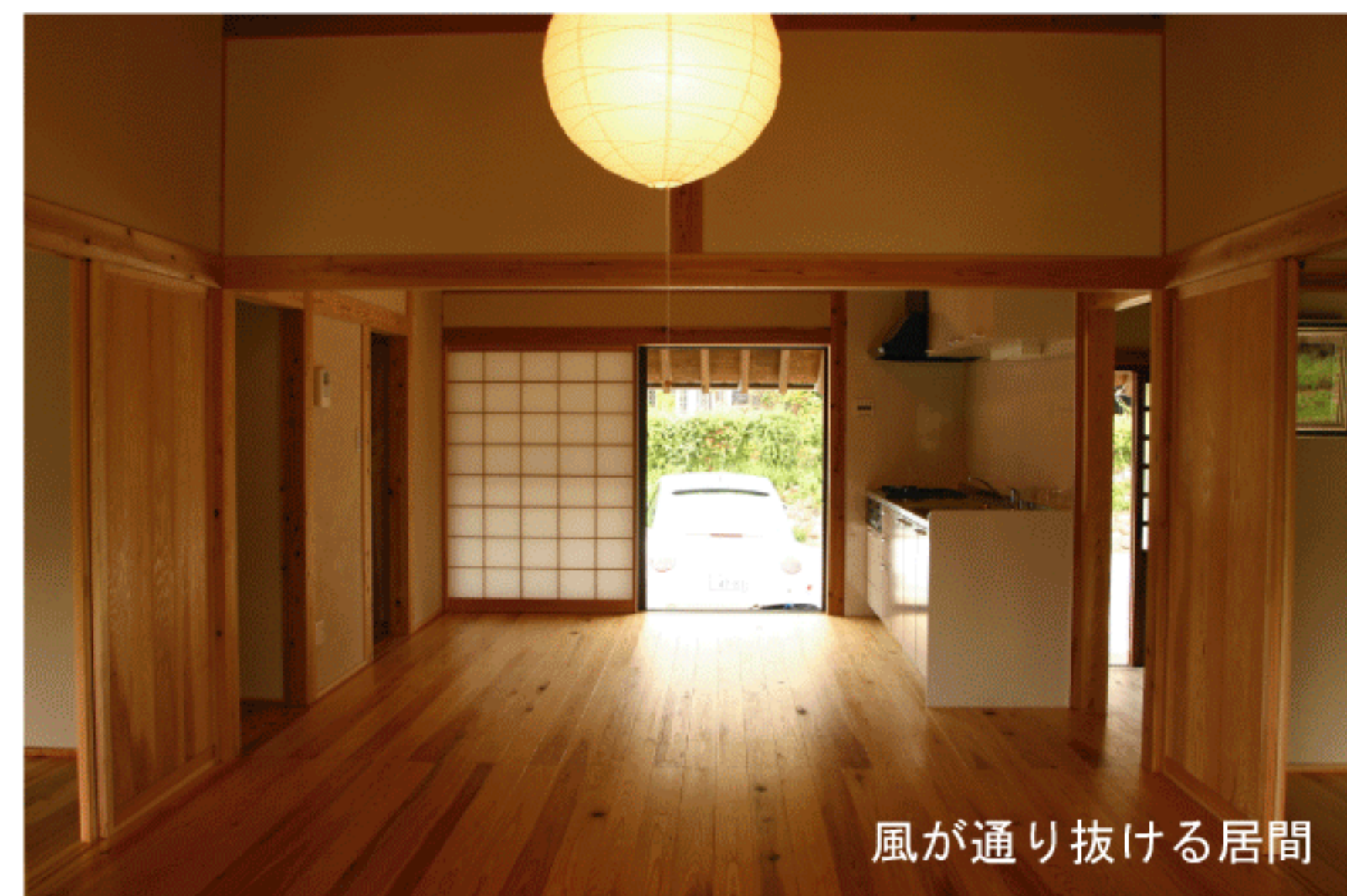
風が通り抜ける居間